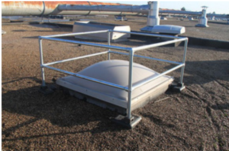
Mesure de protection 2 : mise en place de garde-corps